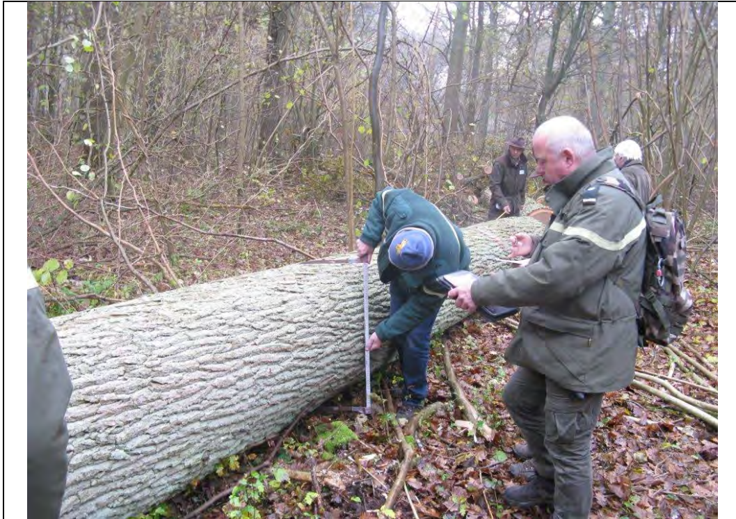
Figuur 2 Op 27 november 2013 selecteren experts van het Franse ONF hieruit een stamstuk van 4,52 m 3 dat van voldoende kwaliteit is om op hun veiling verkocht te worden.

Deze stamstukken haalden een gemiddelde prijs van 583 €/m 3 (BTW en 3% kosten niet inbegrepen), met een minimum van 467 €/m 3 en een maximum van 728 €/m 3 . Om een beter zicht te krijgen op de prijsvorming van kwaliteitshout werd elk stamstuk als een apart lot aangeboden (tabel 1).