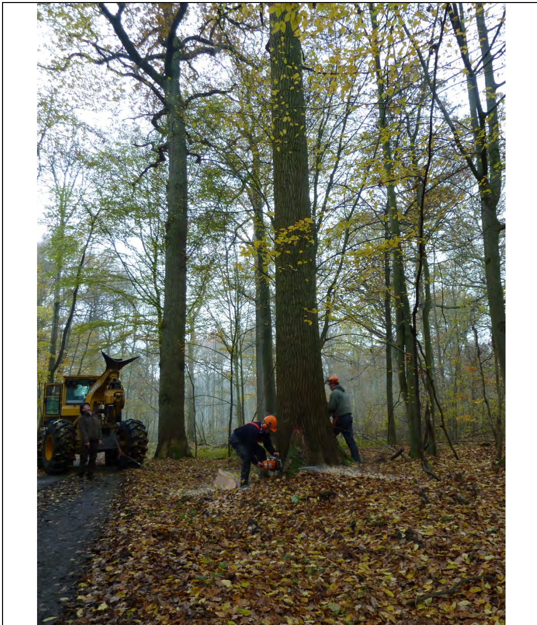
Figuur 1 Op 26 november 2013 werd boom nummer 8 in bestand "De Warande" in het Meerdaalwoud geveld nadat hij een jaar eerder werd gehamerd in uitvoering van een verjongingskap opgenomen in het beheerplan.

Concreet werden een 9-tal bomen van ongeveer 180 jaar oud uit het Meerdaalwoud geselecteerd. Ze waren een jaar eerder gehamerd als onderdeel van een verjongingskap opgenomen in het beheerplan. Ze werden in regie geveld door een erkende exploitant. In samenwerking met onze collega's van het Office National des Forêts (ONF) uit Frankrijk werden de bomen getaxeerd en werd enkel de topkwaliteit, zijnde 5 stamstukken van zomereik, geschikt geacht om aan te bieden op de houtveiling in Saint-Avoid.