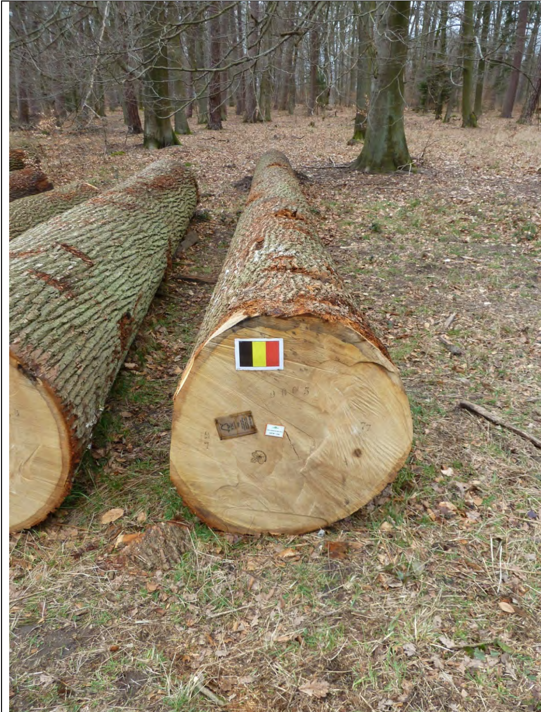
Figuur 3 Op 20 februari 2014 werd het geselecteerde stamstuk op de houtveiling verkocht aan de Duitse zagerij en fineerbedrijf Mehling-Wiesmann voor 2.110 €. Omdat er op de beurs nu hout uit drie landen wordt aangeboden kleefden enthousiaste Franse collega's de Belgische driekleur op de stam.