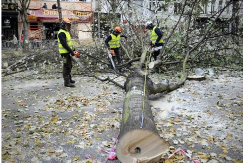
Milieuverenigingen trekken naar Grondwettelijk Hof om straatbomen te redden

(Belga) Heel wat bomen op het openbare domein dreigen te verdwijnen door een geplande aanpassing van het Burgerlijk Wetboek. Acht Vlaamse milieuverenigingen stappen samen naar het Grondwettelijk Hof om de wetwijziging aan te vechten en de straatbomen te redden.